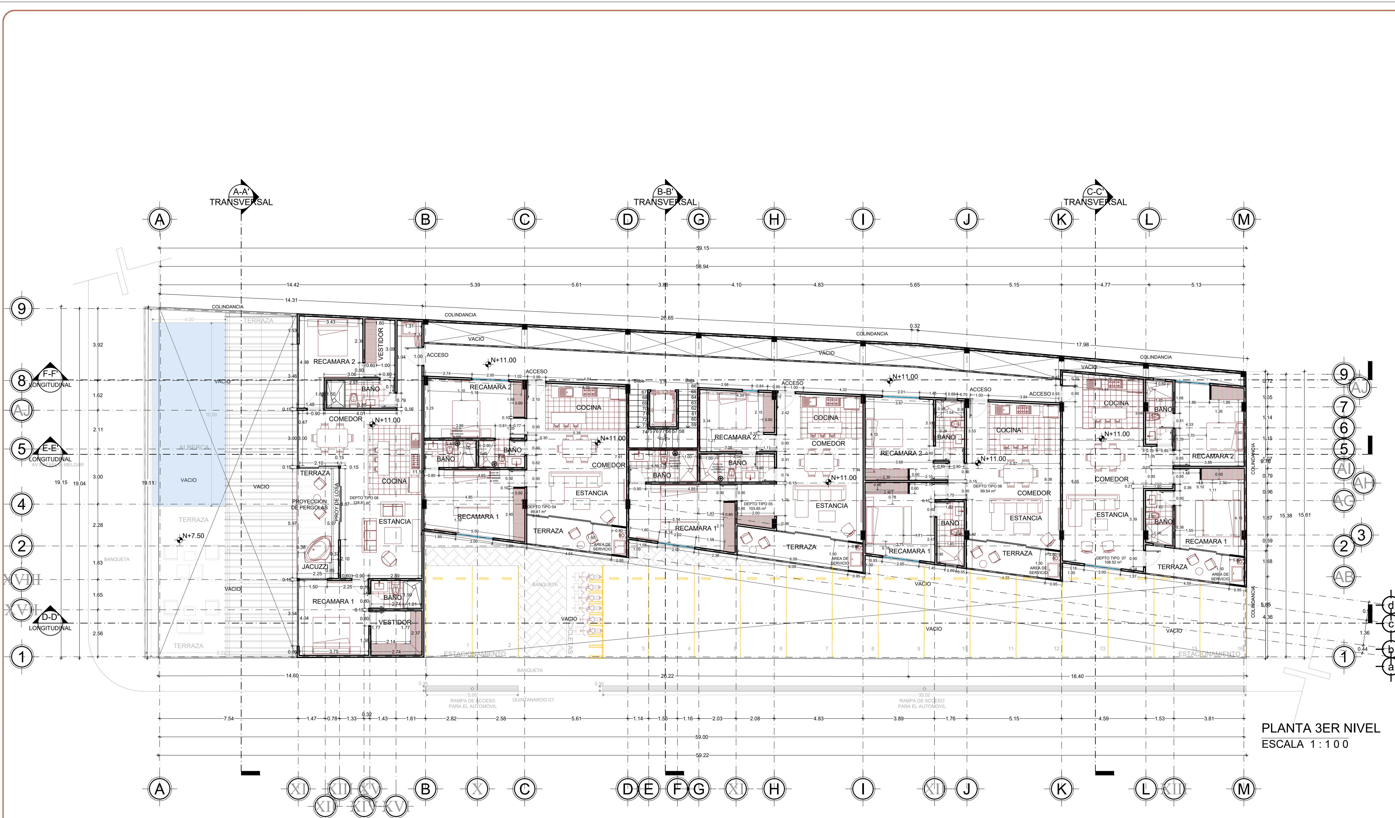
PLANTA 3ER NIVEL ESCALA 1 : 100