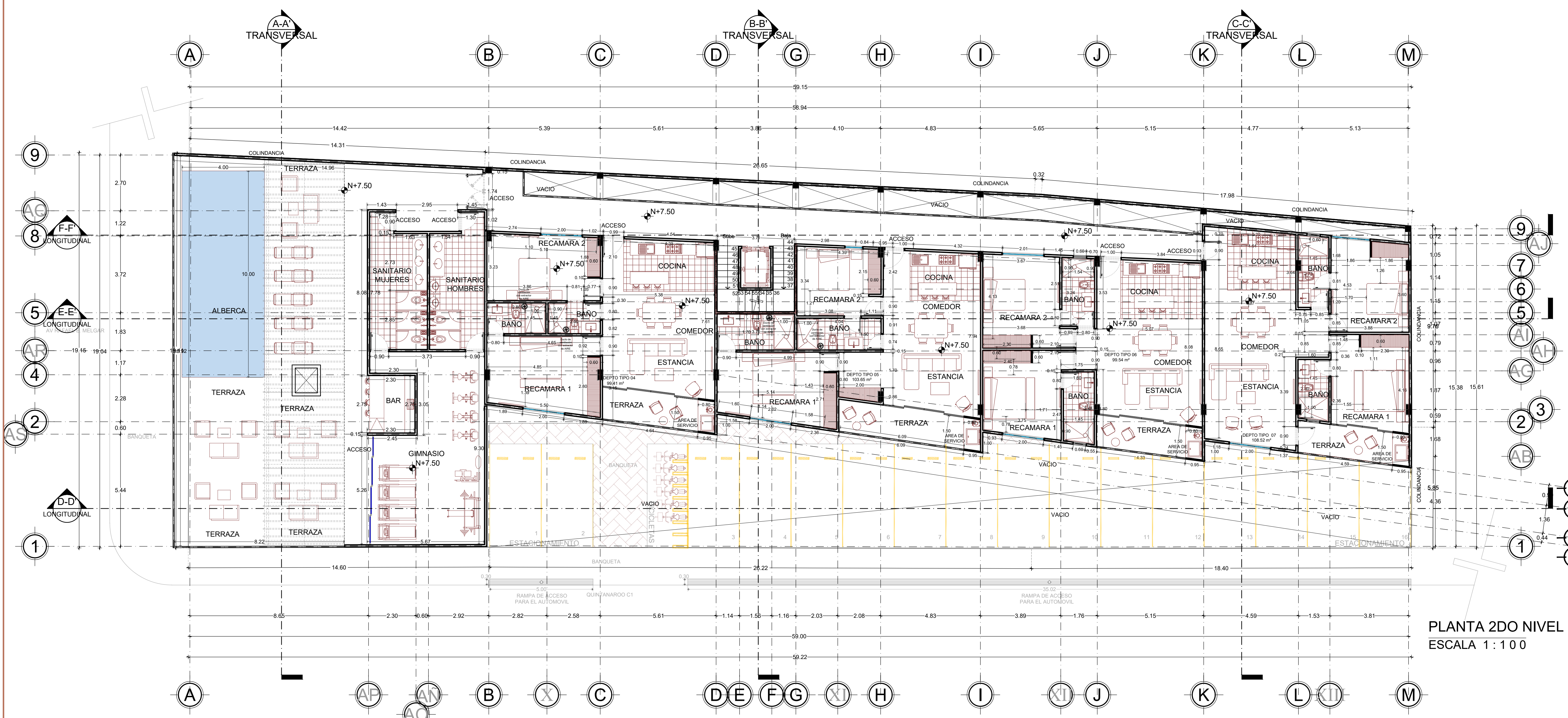
PLANTA 2DO NIVEL ESCALA 1 : 100